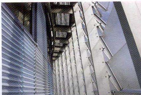
Detalle de la doble piel de la fachada interior

Está configurada mediante una estructura metálica formada por 26 meridianos y 19 paralelos. Esta retícula sustenta directamente los marcos de la carpintería que recogen el doble acristalamiento que cierra los huecos. Sobre los dos paralelos más altos se ha instalado una estructura secundaria que proporciona una base horizontal al conjunto de antenas de la parte superior de la cúpula.