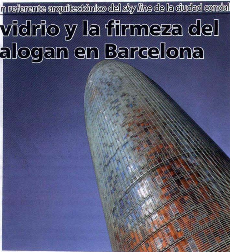
Fachada exterior de la Torre Agbar

La Torre Agbar nace de la unión de dos conceptos antagónicos: la ligereza del vidrio y la solidez del hormigón. Su superficie, inspirada en el legado arquitectónico de Gaudí y en las montañas de Montserrat, surge de la tierra con la potencia y levedad de un géiser para alcanzar el cielo azul de Barcelona. Su estructura remite a un espacio volcánico, con vegetación propia de este terreno y rocas basálticas. La coloración de la Torre evoluciona desde los tonos cálidos de su parte inferior, que semejan las rocas volcánicas en proceso de fusión, hasta los tonos fríos y transparentes de su parte superior, que remiten al agua y al cielo. Esta progresión configura la propia forma del edificio y su colorido. Por lo que respecta a su estructura interior, dos cilindros no concéntricos de planta ovoide, de hormigón hasta la planta 26, emergen de un cráter de agua. Las ventanas recuerdan los fractales. Por encima de esta planta se eleva una cúpula liviana de vidrio y acero. El cilindro interior alberga las escaleras, instalaciones y ascensores especiales (ver RCT nº 140).